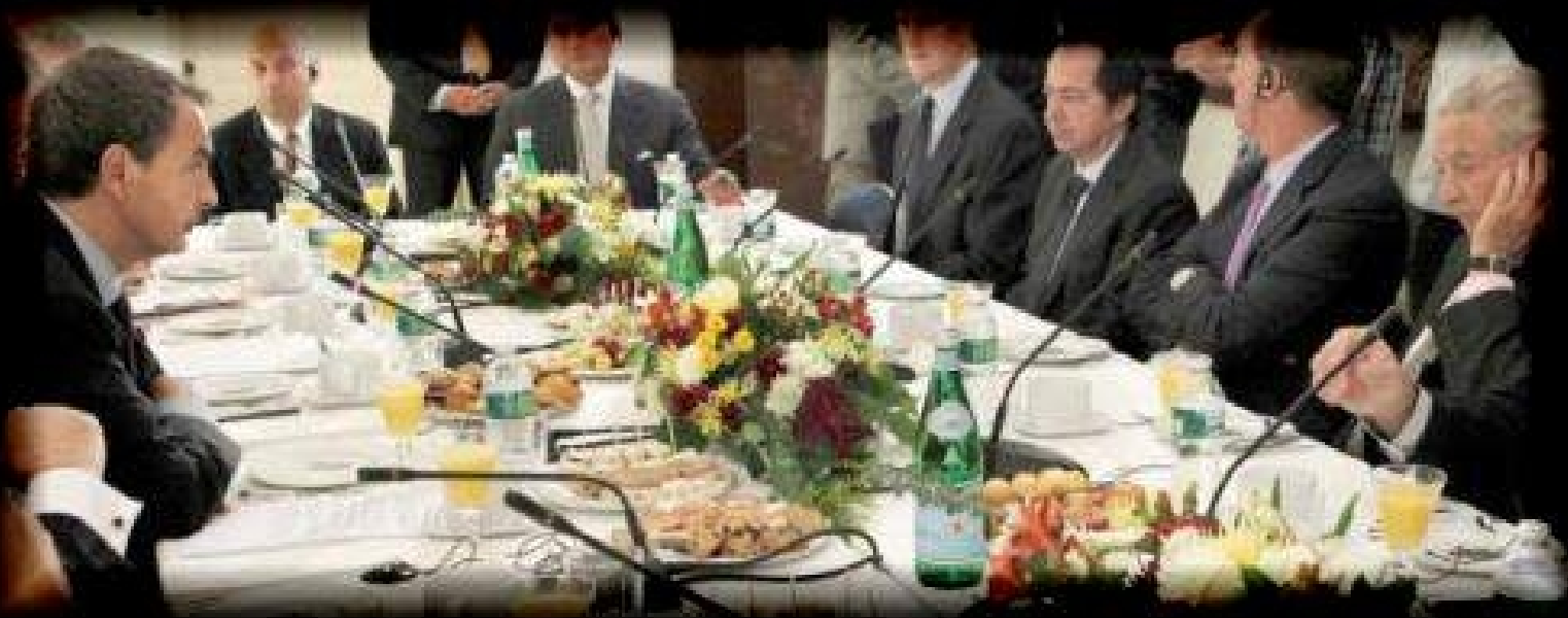
- Rodríguez Zapatero frente a George Soros -

¿Se refiere a los inversores de los fondos, hedge funds , a los que dio explicaciones en directo el Presidente del Gobierno en Nueva York y en agradecimiento especulan con la deuda pública española y logran intereses que triplican los previos a base de desacreditar la “ marca ” España?